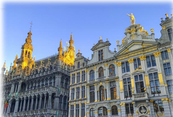
La Grand Place de Bruxelles @Wikipédia