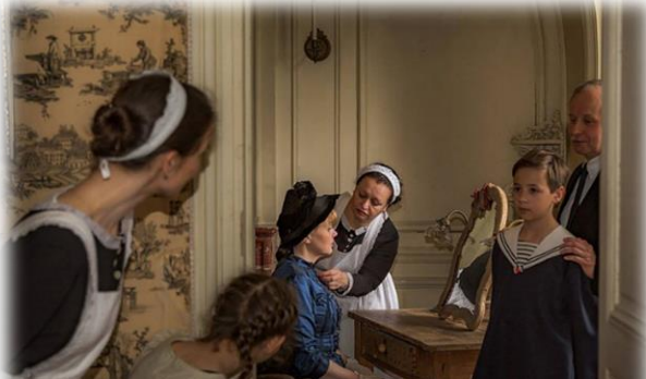
Le Grand Réveillon