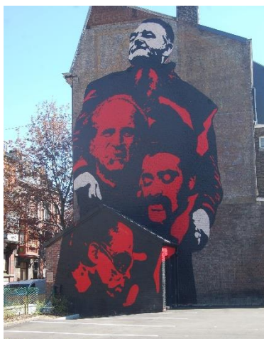
@ Robert Bortolotti

Le Street art ou l'art urbain est à la fois un mouvement artistique et un mode d'expression artistique. Il s'agit de toutes formes d'art réalisé dans la rue ou dans des endroits publics et englobe diverses méthodes telles que le graffiti, le graffiti au pochoir, les stickers, ... Bien que cet art contemporain ne soit pas toujours légal, sa valeur artistique est incontestable et de plus en plus en demande. Depuis 2002, l'Echevinat de la ville de Liège qui a en charge l'art public, a ouvert ses murs au Street art. À la suite des différentes mutations de la ville, certaines œuvres sont éphémères mais la ville compte toujours une trentaine de fresques artistiques. Lors de cette balade, nous pourrions découvrir une douzaine d'œuvres dont plus de la moitié sont remarquables.