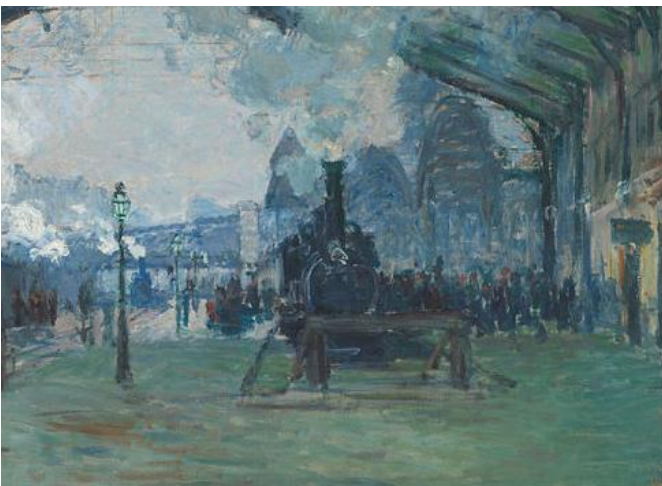
Claude Monet, Arrivée du train de Normandie, gare Saint-Lazare, 1877 (détail)

Expo « Voies de la Modernité » au Musées Royaux des Beaux-Arts et « L'Orient Express » à Train World Mardi 1er février 2022