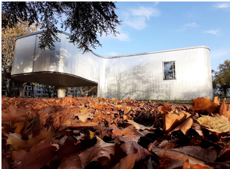
Trinkhall museum 1

Nous vous proposons de découvrir le nouveau Trinkhall. Grâce aux travaux, il a quintuplé la surface que proposait initialement le MADmusée. Ce nouveau musée respecte l'histoire des lieux et offre un espace coupé en plusieurs salles aux ambiances diverses et possède également une bibliothèque mise à la disposition des visiteurs.