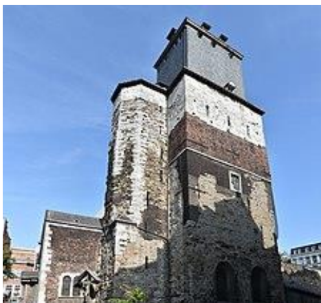
La tour de la collégiale Saint-Denis

Ces deux collégiales ont été fondées sous Notger au 10 ème siècle et toutes deux classées au patrimoine exceptionnel de Wallonie.