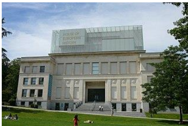
Ancien bâtiment Eastman, quartier Léopold

* Le Rêve est une époque mythique au cours de laquelle des êtres ancestraux ont créé la terre, la faune et la flore, les êtres humains, l'eau, les étoiles... Le mot « Rêves » s'applique à ces esprits mais aussi à leurs voyages et à leurs créations.