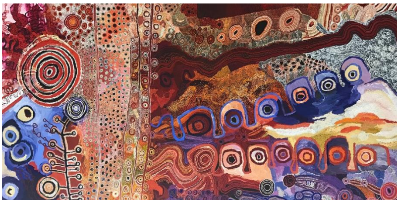
Women's Law alive in our Country, Collaborative women's painting, 2018, © Vincent Girier-Dufournier/Fondation Opale

BEFORE TIME BEGAN explore le Rêve* et la Création, mais aussi la naissance de l'art contemporain.