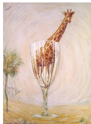
René Magritte. Le bain de cristal